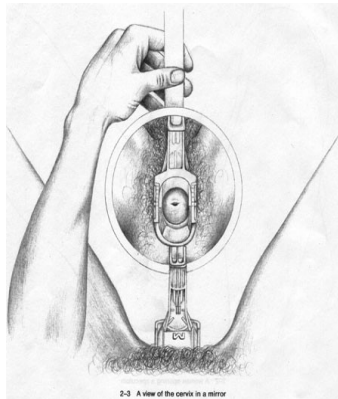
2-3 A view of the cervix in a mirror