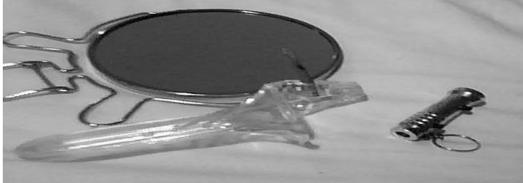
Foto do meu próprio espécúlo, comprado em farmácia, espelho (aqueles com um lado que amplia, é bom!) e uma lanterninha pequena.

O auto-exame com espécúlo é basicamente a versão faça-você-mesma do exame "Papa Nicolau", feito nos consultórios médicos, só que sem a coleta de secreções. Com este auto-exame, podemos ver a parte interna da vagina, inclusive nosso próprio colo do útero. É sempre interessante fazer anotações, ou ainda tirar fotos, para notarmos as diferenças e possíveis anormalidades. Lembrando ainda que o colo do útero também muda durante as etapas do ciclo menstrual, por isso é bom realizar os auto-exames na mesma época, ou ainda, para ver as mudanças, o fazendo em momentos diferentes: antes da menstruação, depois, e assim por diante, sendo assim também possível se familiarizar com a própria fertilidade.